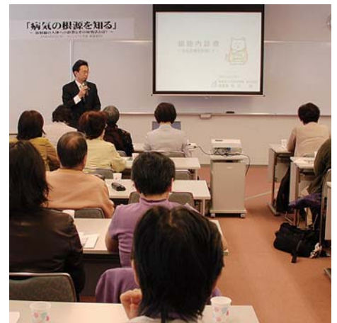
健康講演会の様子

本社 東京都渋谷区広尾1-12-16 Hanasakiビル3F TEL 03-5798-8017 FAX 03-5798-8019 関東営業本部 埼玉県さいたま市南区白幡5-3-3 TEL 048-838-7813 FAX 048-838-7815 関西営業本部 奈良県大和郡山市杉町181-1 TEL 0743-59-6033 FAX 0743-56-8531