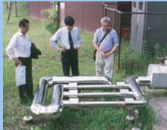
ゴルフ場のすばらしいグリーン