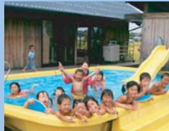
岐阜県 社会福祉法人石山保育園