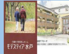
介護付き 有料老人ホーム