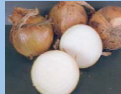
糖度16のおいしい「タマネギ」