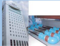
ナチュラルホテル エルセラーン (名古屋)