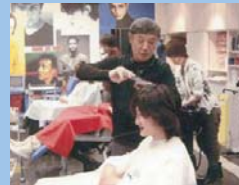
スタッフの手が荒れない美容室