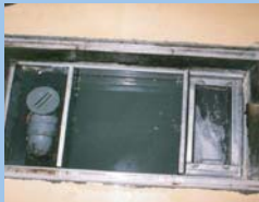
レストランのグリーストラップ