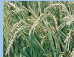
東北稲作コンクールで 上位1位2位独占!