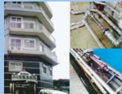
大阪 汐ノ宮温泉病院