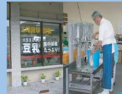
沖縄 大豆丸ごと豆腐