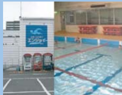
スポーツクラブ エンジョイ岡南