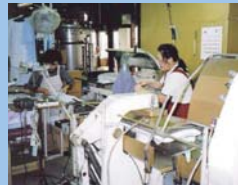
無洗剤ウェットクリーニング 埼玉アンテナショップ