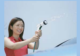
家庭内でも洗剤なし