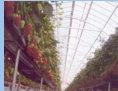
鈴なりの「イチゴ」(糖度18.5)