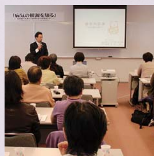
健康講演会の様子

西日本 奈良県大和郡山市杉町181-1 TEL 0743-59-6033 FAX 0743-56-8531